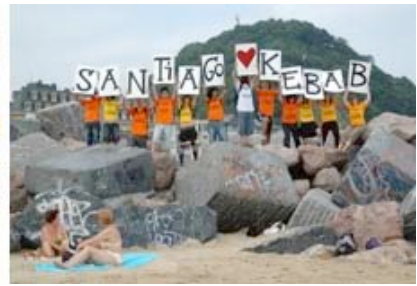
Taller 100% TERRITORIO MÓVIL / DINAMIKTTAK'07 - Do it your music / DINAMIKTTAK'06 - Santiago Loves Kebab